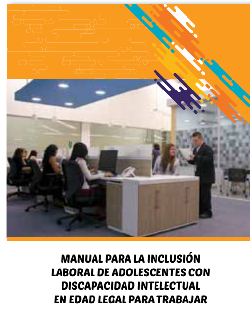
MANUAL PARA LA INCLUSIÓN LABORAL DE ADOLESCENTES CON DISCAPACIDAD INTELECTUAL EN EDAD LEGAL PARA TRABAJAR

Este instrumento constituye un avance en materia de inclusión laboral, pues ha sistematizado la experiencia de Fundación El Triángulo, la cual ha sido puesta a disposición del Ministerio de Trabajo a fin de que sea una guía en el proceso de inclusión de personas con discapacidad intelectual y pueda generar nuevas oportunidades para el grupo poblacional indicado.